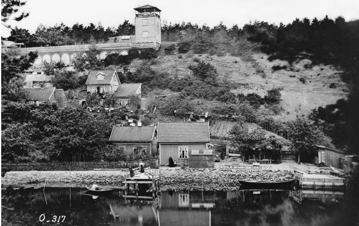
Tivoliet og festlokalet Fredriksborg på Bygdøy, der Vinje heldt fleire festtalar, fotografert i tidsrommet 1863–1883.