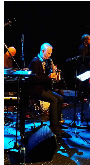
Frå Litteraturdagane i Vinje 2018

Som eit ledd i opptrappinga mot full drift av Vinjesenteret for dikting og journalistikk opprettar Nynorsk kultursentrum 1. mars 2019 stillinga som museums- og festivalsekretær. Den som blir tilsett kjem til å arbeide tett i lag med dagleg leiar for Vinjesenteret og frivillige lag og enkeltpersonar for å skape ein ny kulturinstitusjon i Telemark. Søknadsfrist 14. januar 2019. Sjø heile utlysinga på Vinjesenteret.no